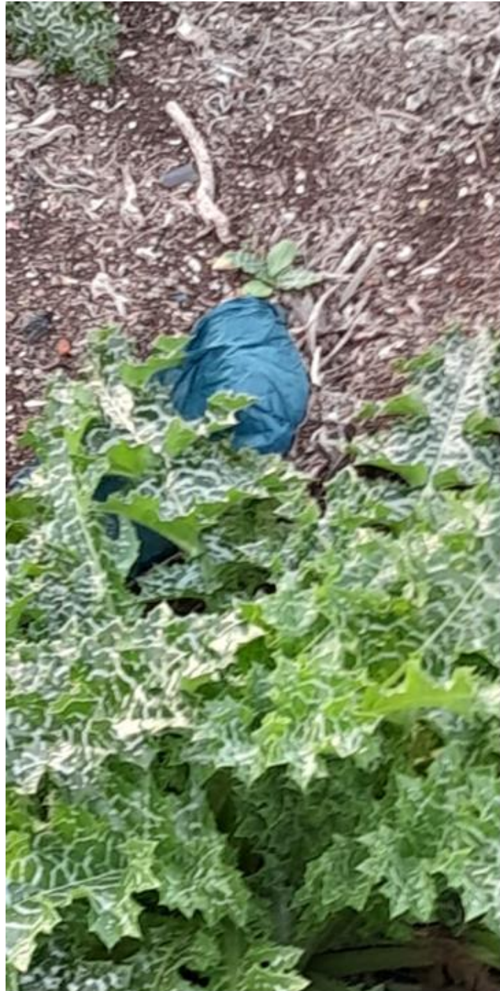
Photo 11 et 12 : déchets et surface – formation de galerie de rongeur et pousse de chardons sur toute la zone – février 2024