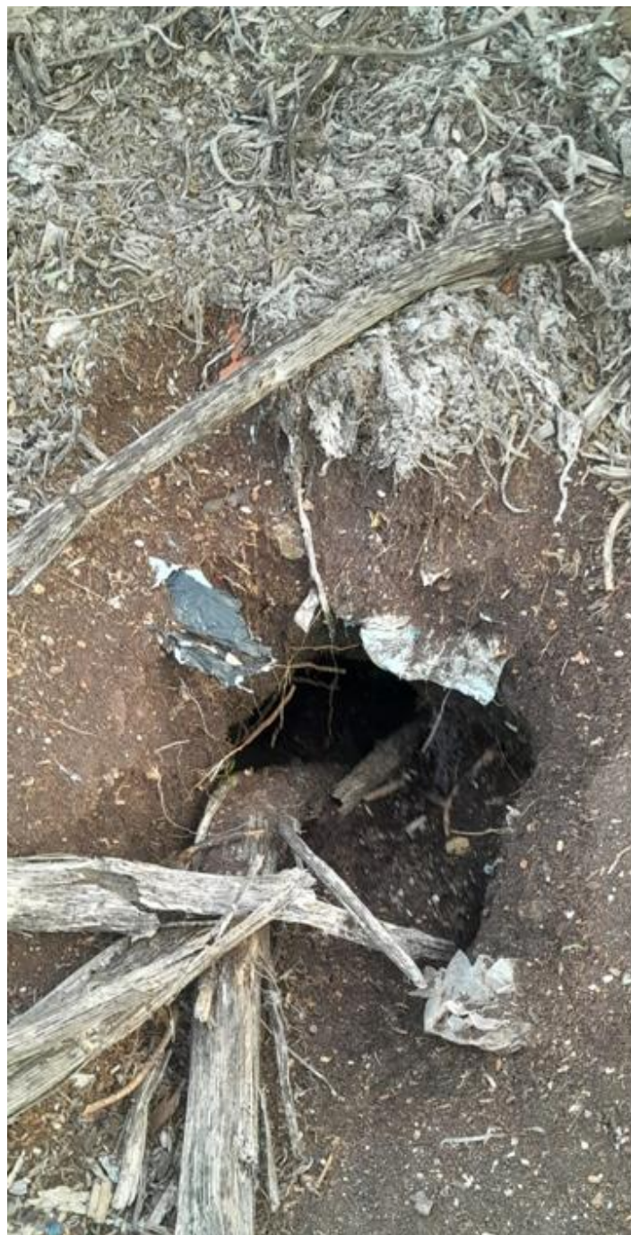
Photos 9 et 10 : déchets en surface et galerie de rongeur – février 2024