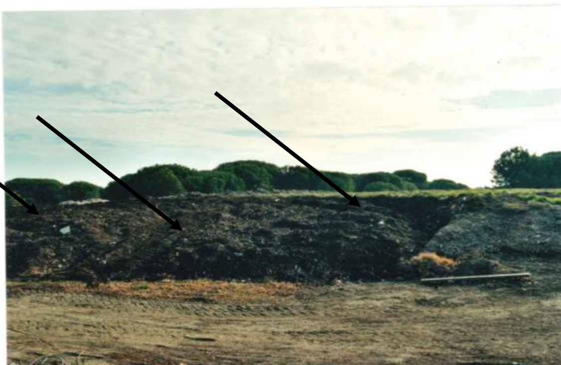
Photos 6 et 7 - Janvier 2002 – remblais divers (Inertes BTP , photo du haut, déchets ménagers , photo du bas, flèches )

En juin 2023 : L'AGME a organisé une action de sensibilisation des scolaires à la question des déchets sur la presqu'île. Une collecte par les enfants a donné un volume important ( photo 8)