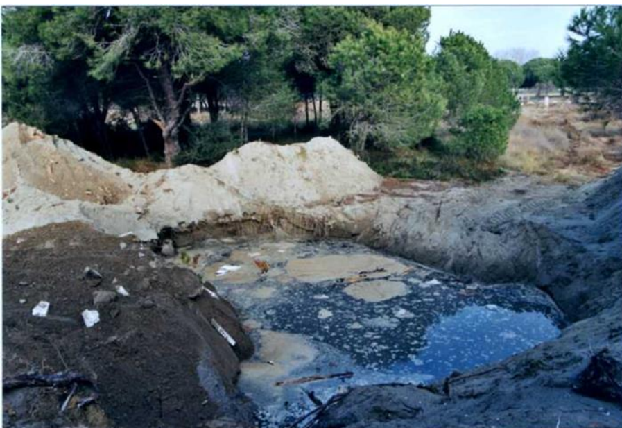
Photo 1 - Exemple de fosse de dépôt contenant des jus en 2001

Cette situation est à l'origine de la création de l'association Grande Motte Environnement en 2001 dont la première action a été de faire cesser ces dépôts. En 2001, l'intervention de l'AGME a permis l'arrêt des apports et le retrait de 25 000 tonnes de déchets et les fosses contenant des lixiviats (photo 1 – 2001) ont été remblayées, avec des matériaux de qualité douteuse (photos 6 et 7).