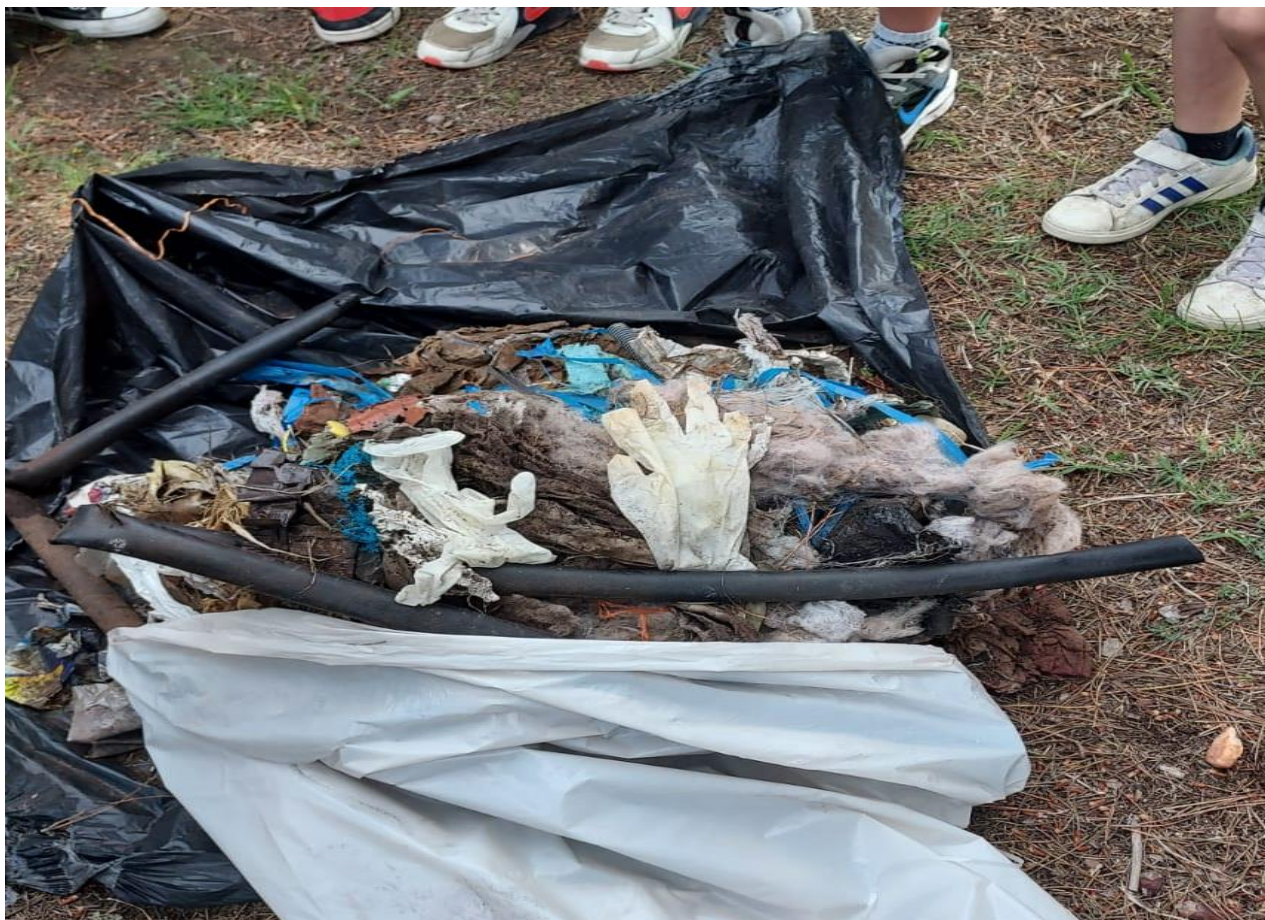
Photo 8 – une partie des déchets collectés par des enfants en juin 2023