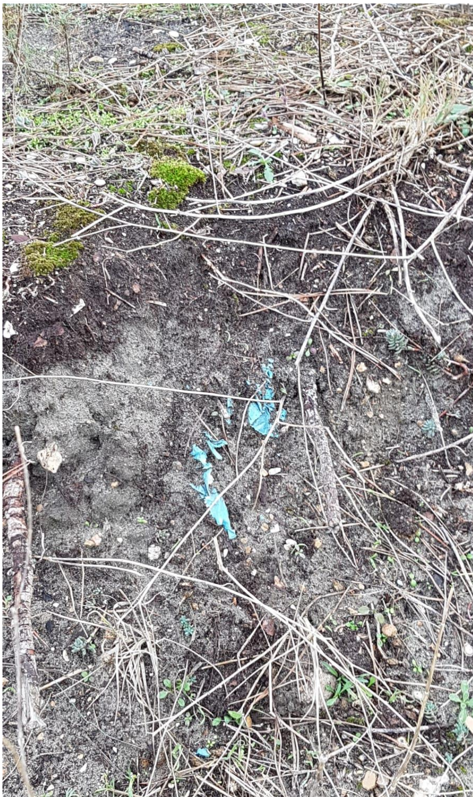
Photo 9 : vue en coupe du remblais ( nombreux micro et macro plastiques) – janvier 2020