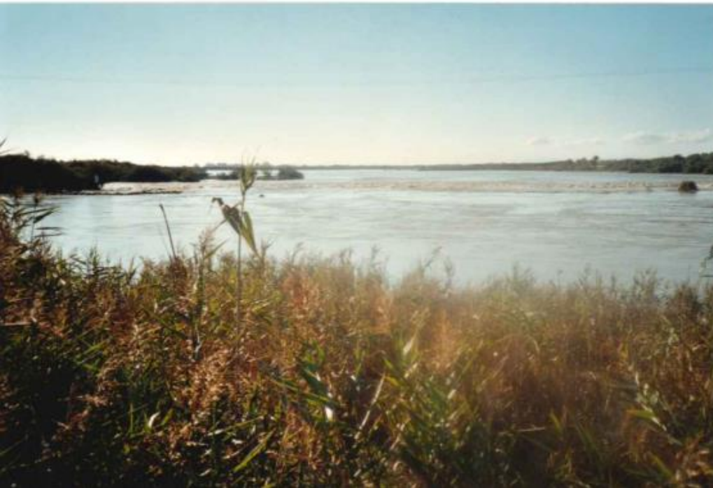
Photo 4 et 5 Janvier 2002 – Dépôt de bois et entrée marine sur l'étang